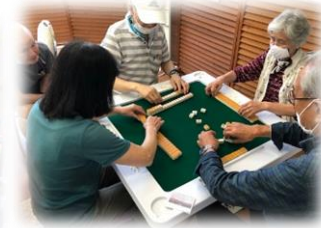
「カフェと健康マージャン」