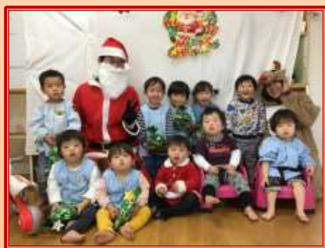
今年もサンタさんがやって来た! (まちの子ども保育園)